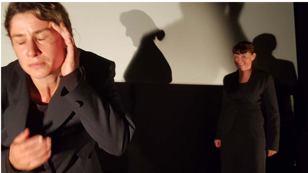
Spectacle « Ravages »

Les 2 actrices et le régisseur ont relevé ce défi de façon magnifique en questionnant à travers vidéo, sketch, images, textes, la violence ordinaire du travail.